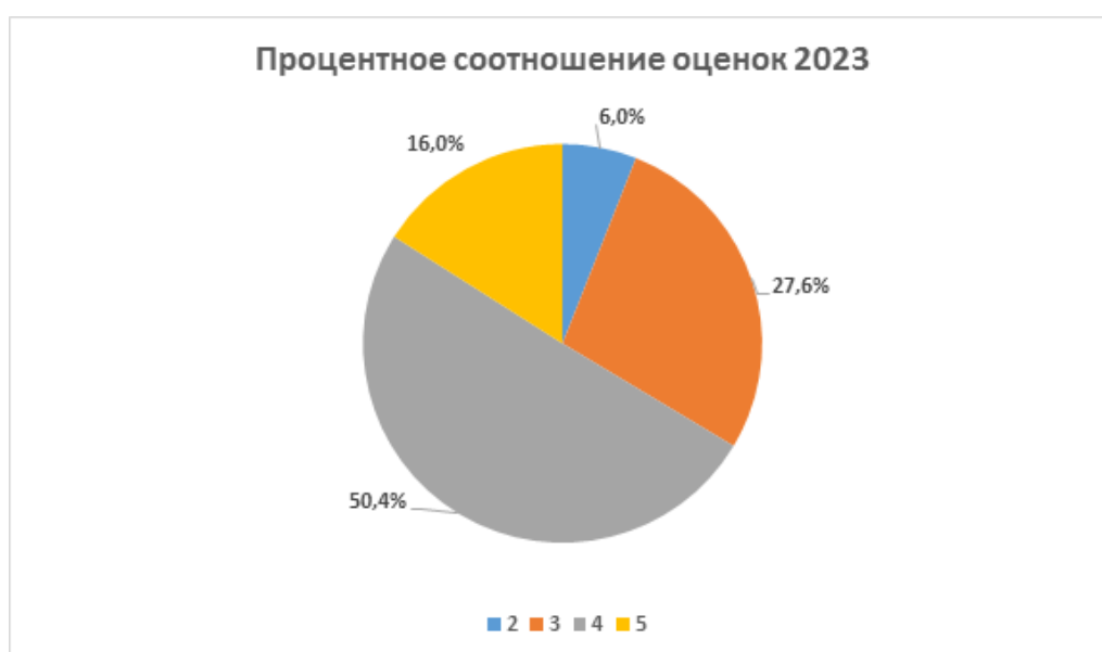
Диаграмма «Процентное соотношение оценок» 2023

Соответствие результатов ВПР по русскому языку внутренней экспертизе